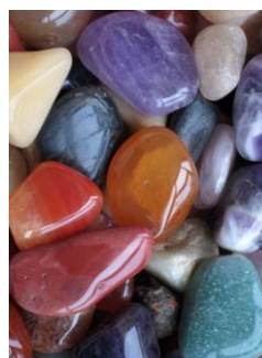
Gepolijste stenen

Slijpen kan vanaf 13.00 uur tot 16.30 uur. Het betreft een doorlopende activiteit, op elk gewenst moment kan worden deelgenomen. Openingstijd museum: zondagmiddag van 13.00 uur tot 17.00 uur. Het museum bevindt zich direct naast het terrein van stadsboerderij Darwinpark, aan de Thijssestraat 1 te Zaandam. Zie verder: www.zaansnatuurmilieucentrum.nl